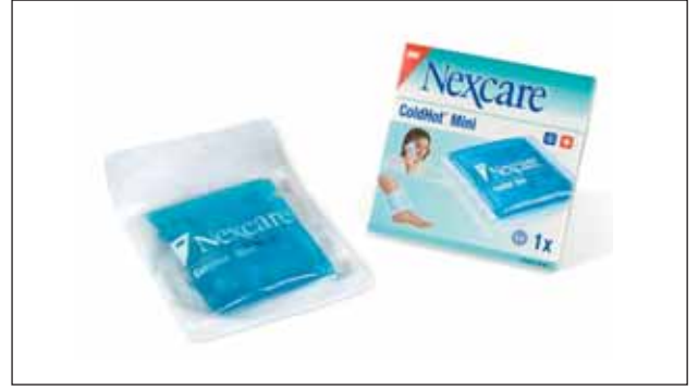
Nexcare Cold Hot Mini

Travma sonrası soğuk uygulamaları için çok kullanımlık kompres paketi.