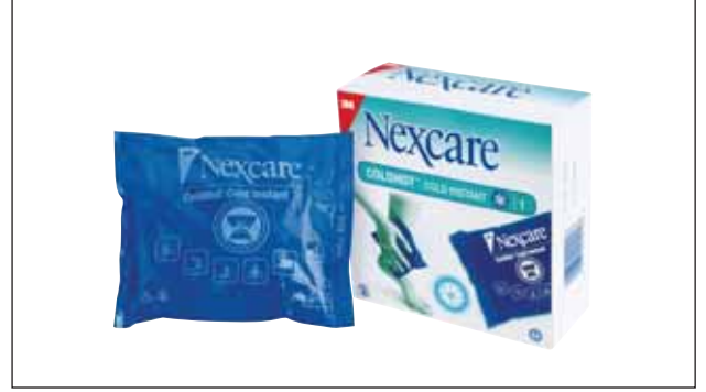
Nexcare Anında Hazır Soğuk Kompres Paketi