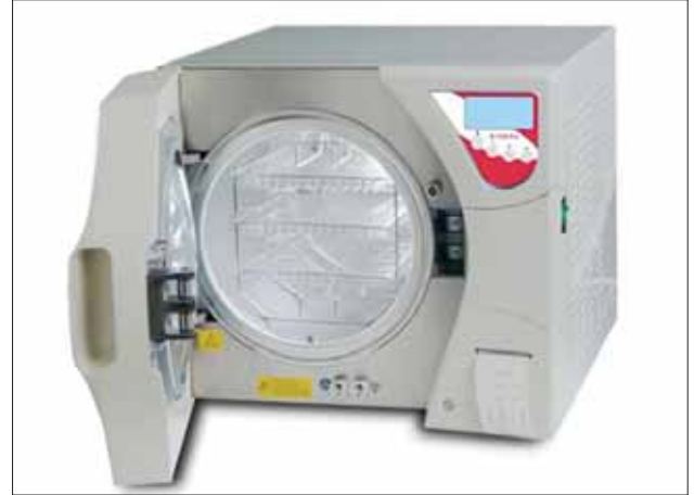
B170N PRO P