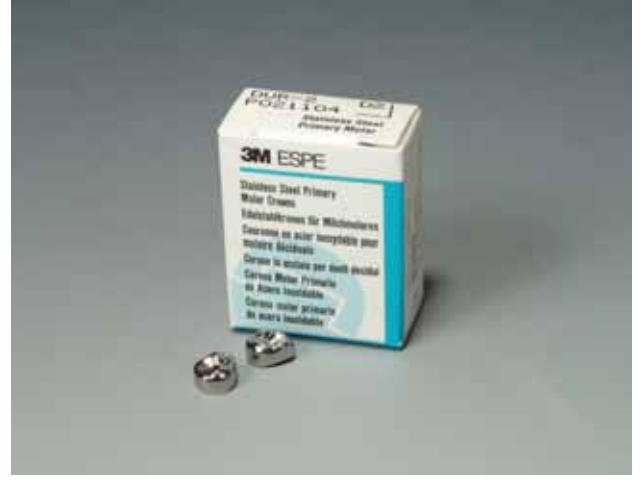
Paslanmaz Çelik Kuron Yedeği